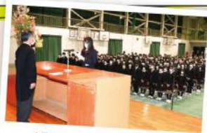
4月8日 暁高等学校(3年制)