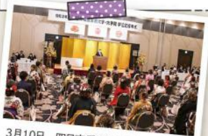
3月10日 四日市看護医療大学・大学院