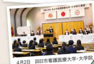
4月2日 四日市看護医療大学・大学院