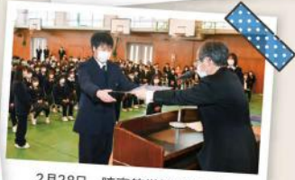
2月28日 暁高等学校(6年制)