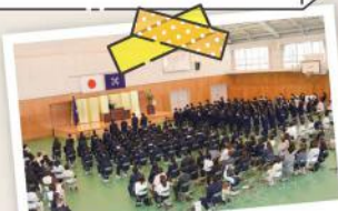
4月7日 暁高等学校(6年制)