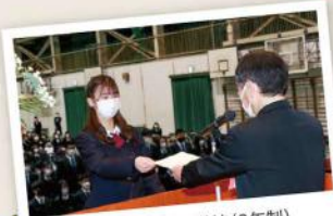
3月31日 暁高等学校(3年制)