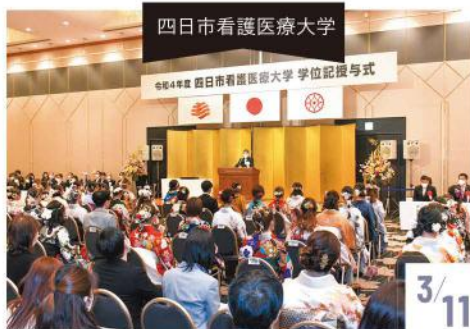
四日市看護医療大学