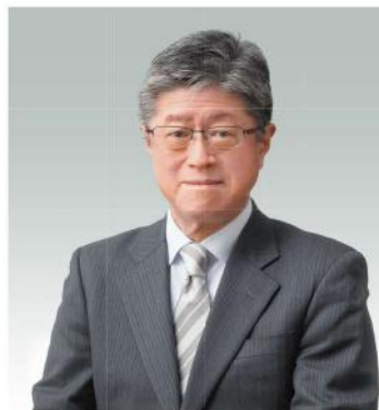
四日市看護医療大学 学長

人生100年時代、少子高齢化の中で四日市市、三重県、わが国の保健・医療をめぐる情勢は皆さんが医療人として一人前になる頃には大きく変わります。かけがえのない学生生活の一日一日を大切に、人々の健康に関心を持ち続け、将来医療人として自分に何ができるかイメージしながら、そして時々世界に目を向けて人類の未来を想像してみましょう。何より楽しい学生生活になることを期待しています。